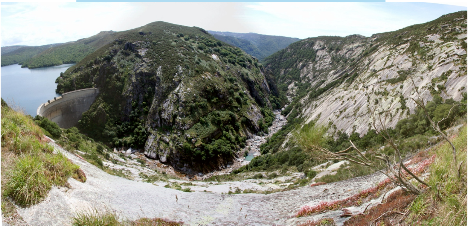
Panorámica desde o alto da canteira: encoro, presa do Eume, Penedo Empardado e canón