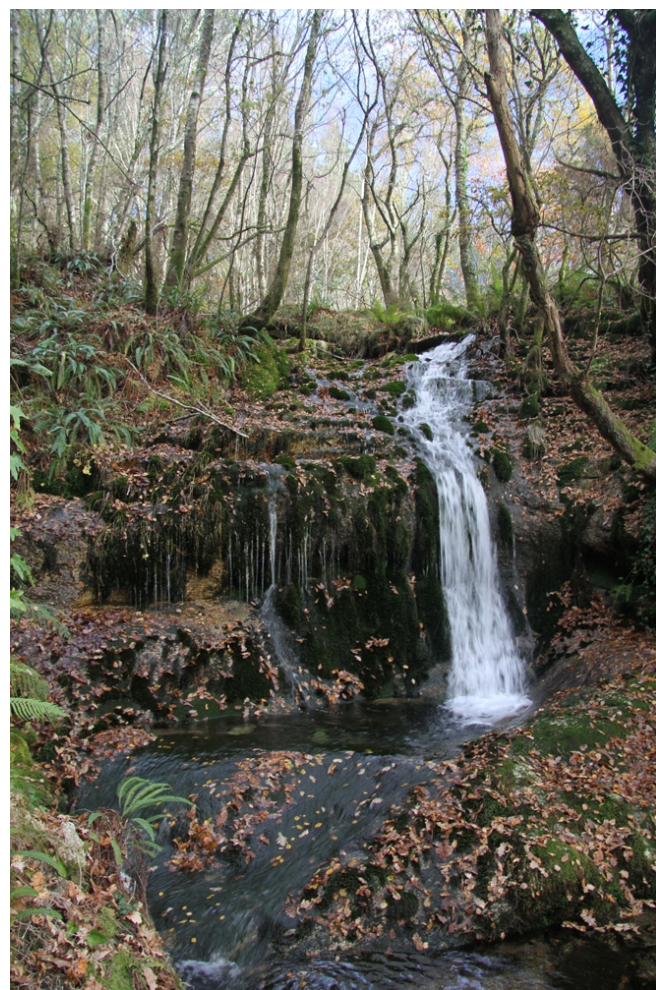
Ferverza no rego de Vilaríño