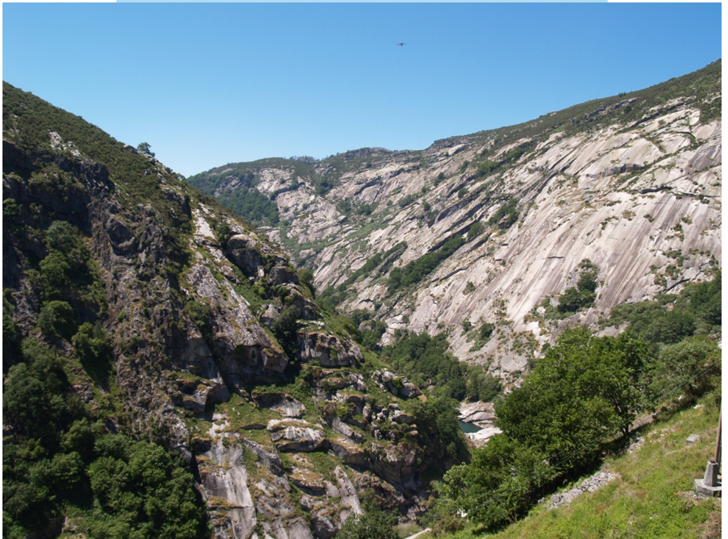
Paredes graníticas do Canón do Eume