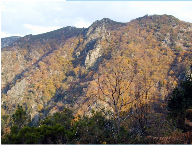
Outono no Canón do Eume