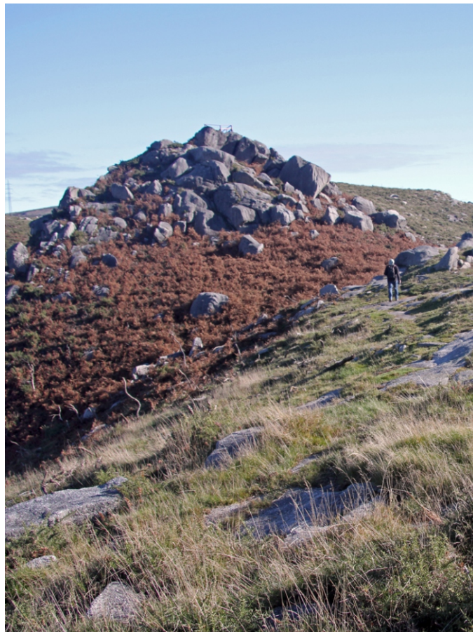
Cume co miradoiro