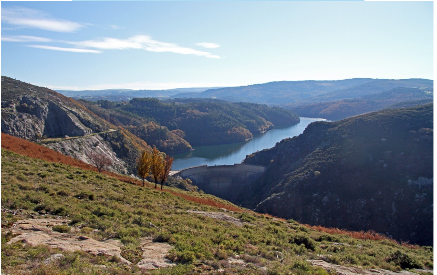
Panorámica desde o miradoiro cara ao encoro do Eume