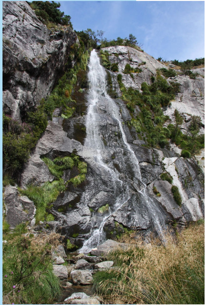
Fervenza do rego de Morixoso.