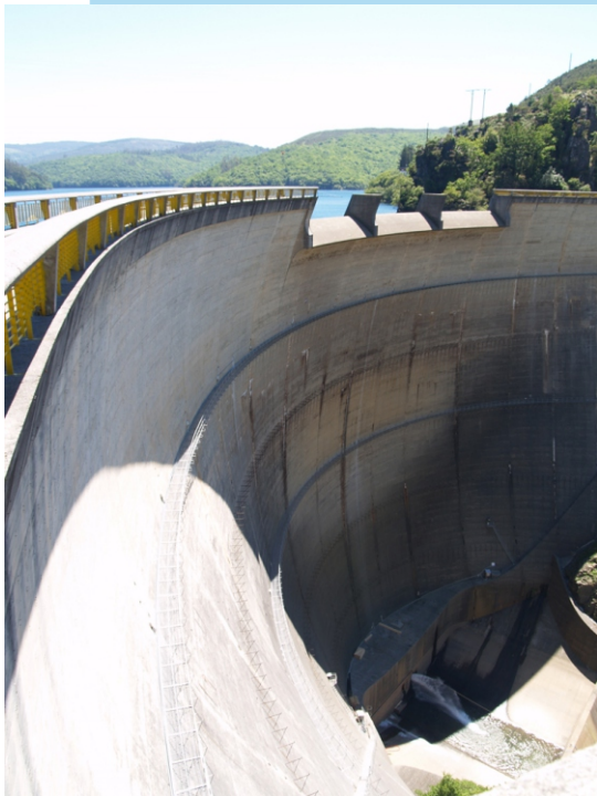
Presa do Eume