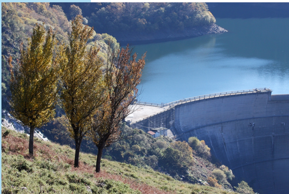
Presas do Eume

No concello da Capela, entre as localidades de Vilarinho e Teixido, hai unha pequena ruta, circular de 5 km, que nos achega outra perspectiva, a sumar as moitas das que podemos gozar desde diferentes puntos, do profundo canón polo que o río Eume pasa entre os granitos dos montes do Forgoselo e os xistos da serra do Queixeiro: A ruta do miradoiro do Eume, incluída no Parque Natural “Fragas do Eume”.